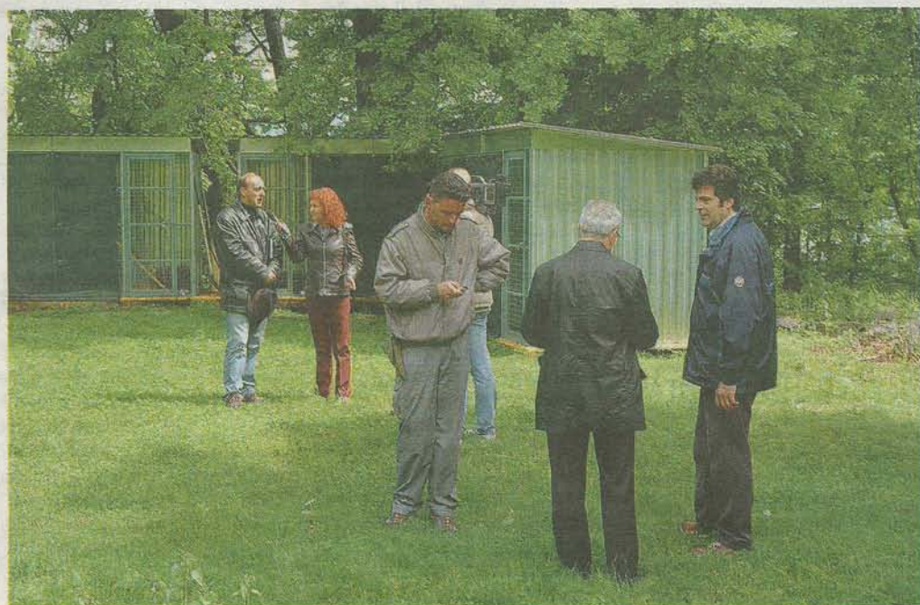
Il Cras del Vco si trova in una zona del parco di Villa Pallavicino a Stresa

La Provincia del Vco ha deciso di chiudere il Cras “Il servizio non è un obbligo e le priorità sono altre”