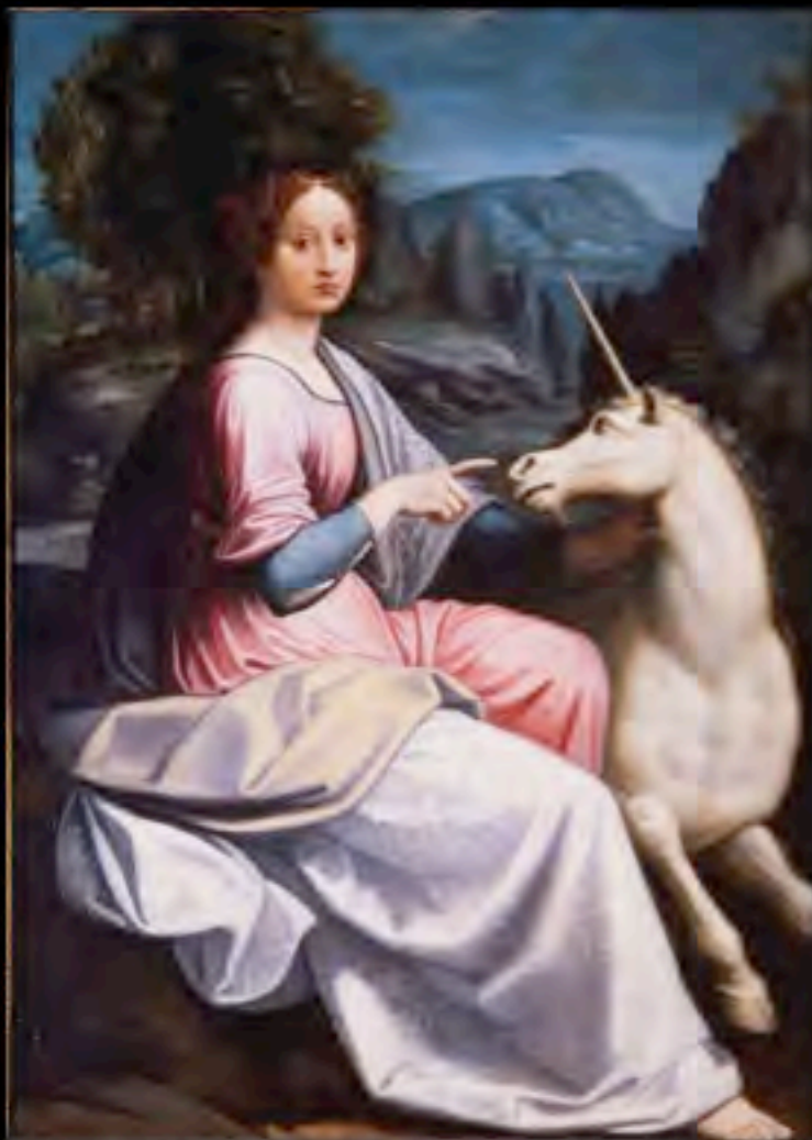
Luca Longhi (1507-1580), Dama con Unicornio