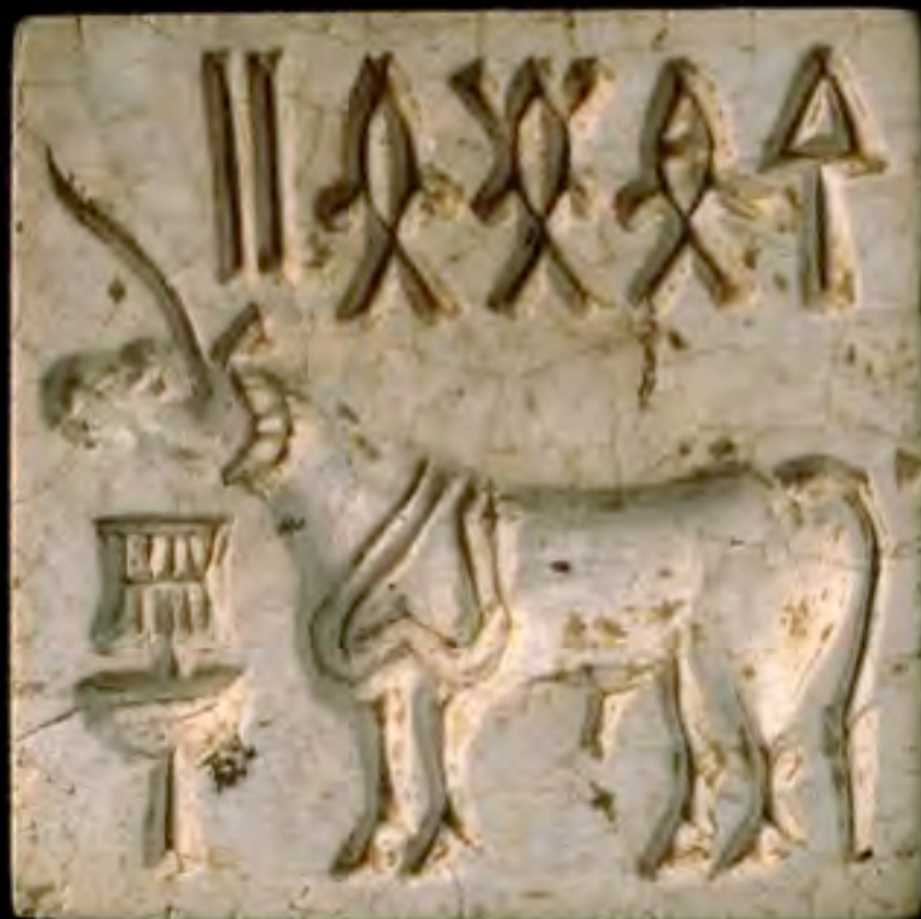
Piastra / sigillo che rappresenta un Unicorno, civiltà dell'Indo, 2000 a.C.