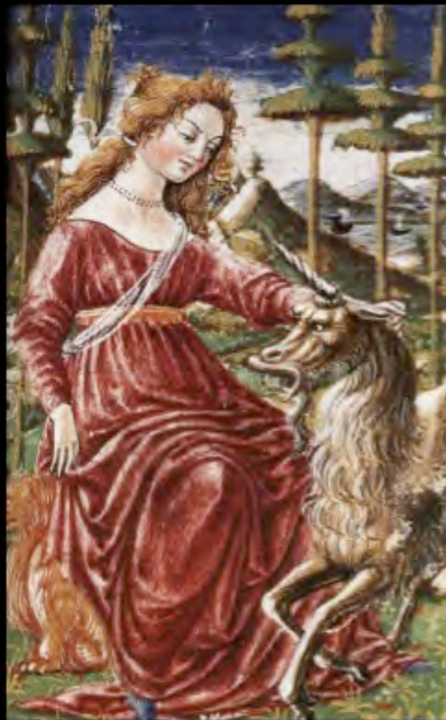
Francesco di Giorgio Martini, La castità con l'Unicorno , 1463