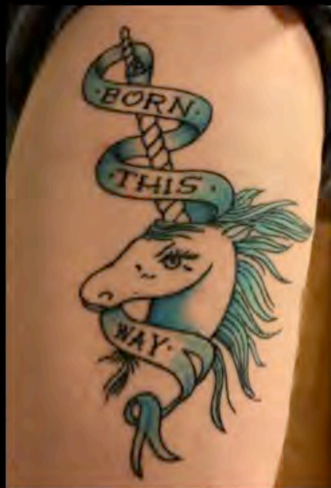
Tatuaggio della cantante Lady Gaga