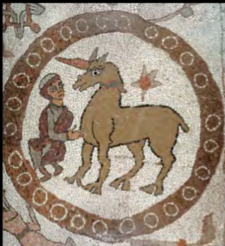
Una vergine accarezza un Unicorno, mosaico pavimentale della Cattedrale di Otranto, XII sec. d.C.