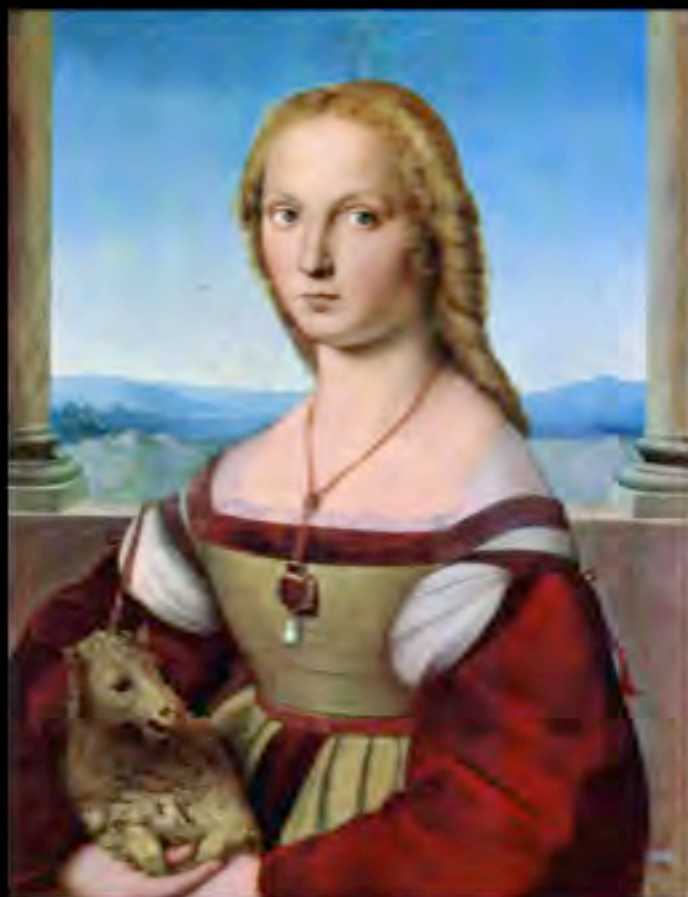
Raffaello Sanzio, Dama con Liocorno , 1506-1507

Il quadro ha una storia molto interessante, perché fu restaurato già nel '500 e trasformata in una Santa Caterina, sostituendo il piccolo Unicornio con un cagnolino, mentre rappresenta (forse) Giulia Farnese, amante del papa Alessandro VI Borgia.