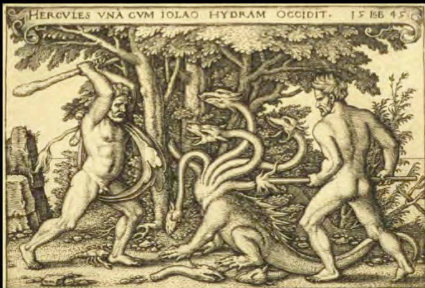
Ercole uccide l'Idra con l'aiuto di Iolao (che cauterizza il collo delle teste tagliate) incisione su metallo di Sebald Beham, 1545