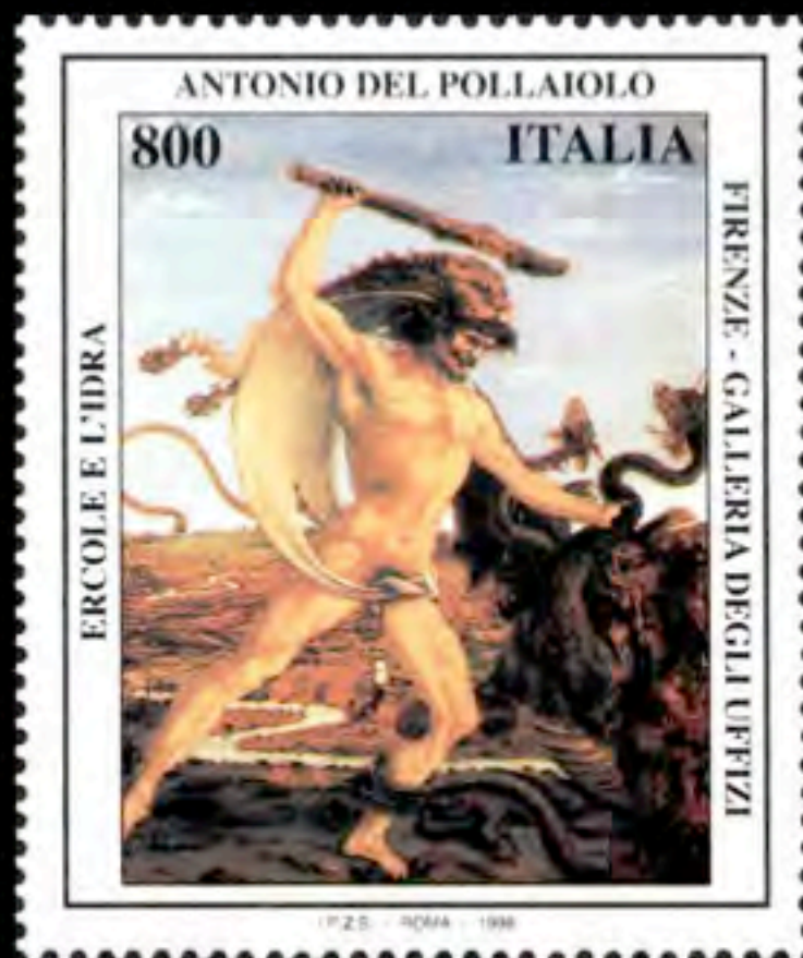
Antonio del Pollaiuolo, Ercole e l'Idra , 1475 francobollo commemorativo del centenario della morte, 1998