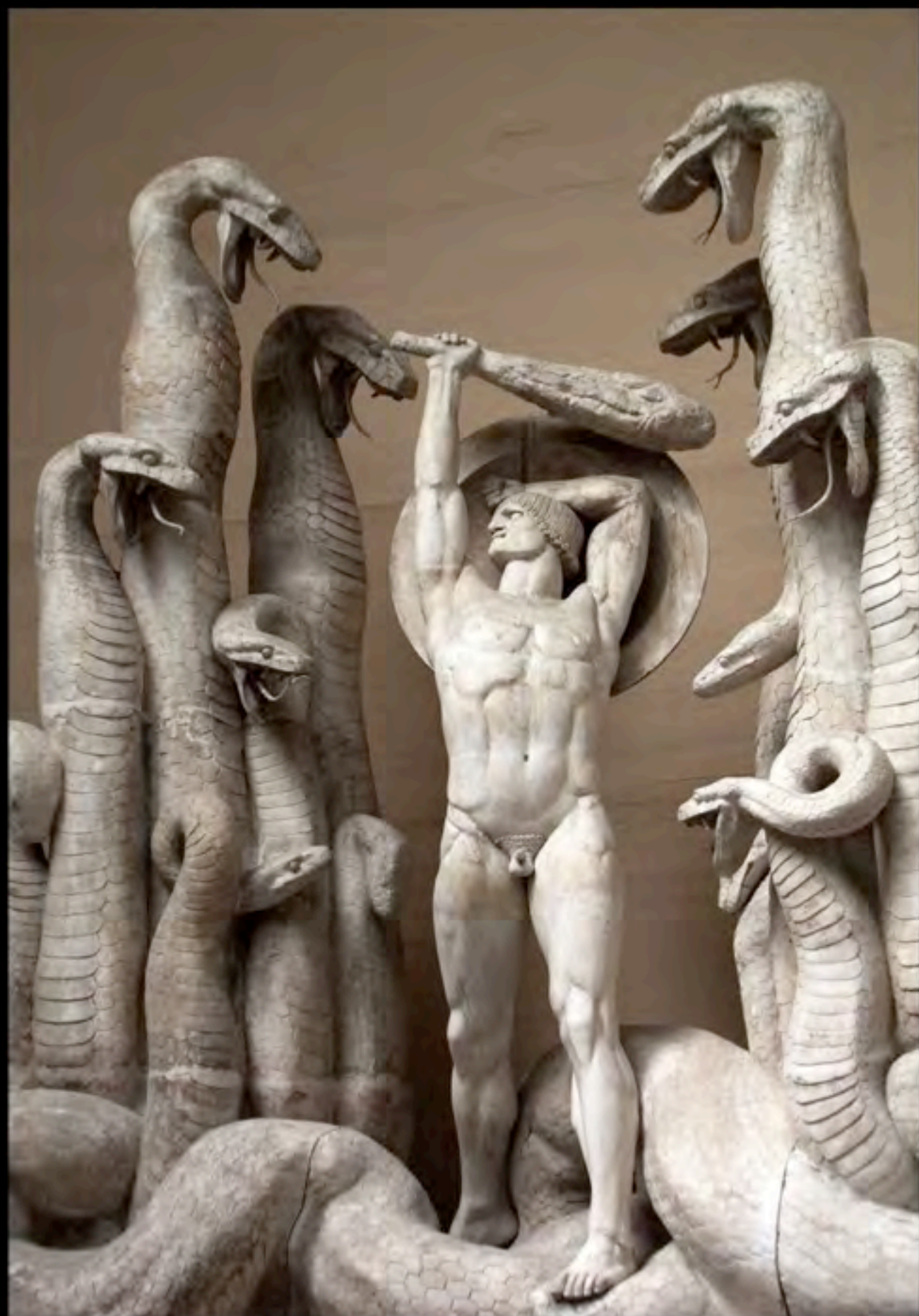
Rudolph-Tegner, Herakles og ydraen , 1919 Helsingør