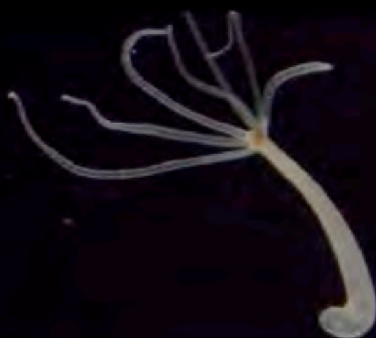
Immagini al microscopio di Hydra vulgaris , circa 40 ingrandimenti