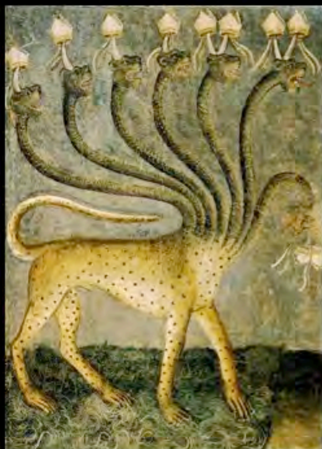
Giusto de' Menabuoi, immagine dal ciclo dell'Apocalisse padovana , 1375-1378, Battistero del Duomo di Padova