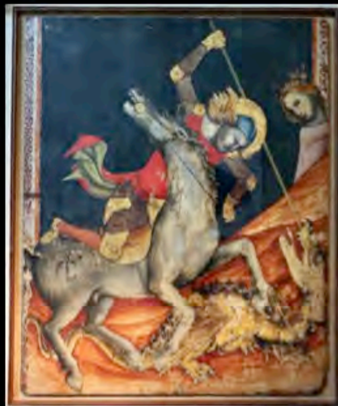
Vitale da Bologna, San Giorgio e il drago , 1330