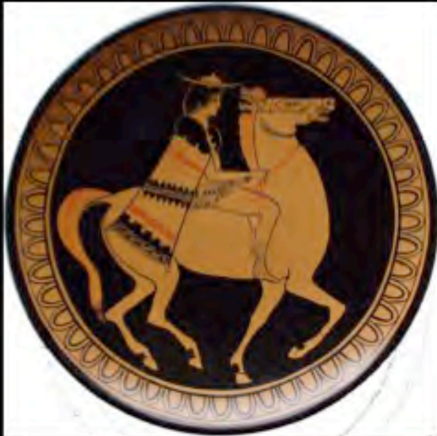
Il giovane Leadro di Atene a cavallo, dipinto dal pittore Onesimo all' interno di una coppa del ceramista Eufronio, Grecia, ca V secolo a.C.