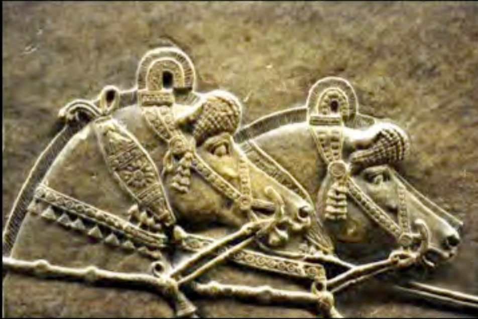
Cavalli assiri durante la caccia al leone, Ninive (Iraq), VII secolo a.C.