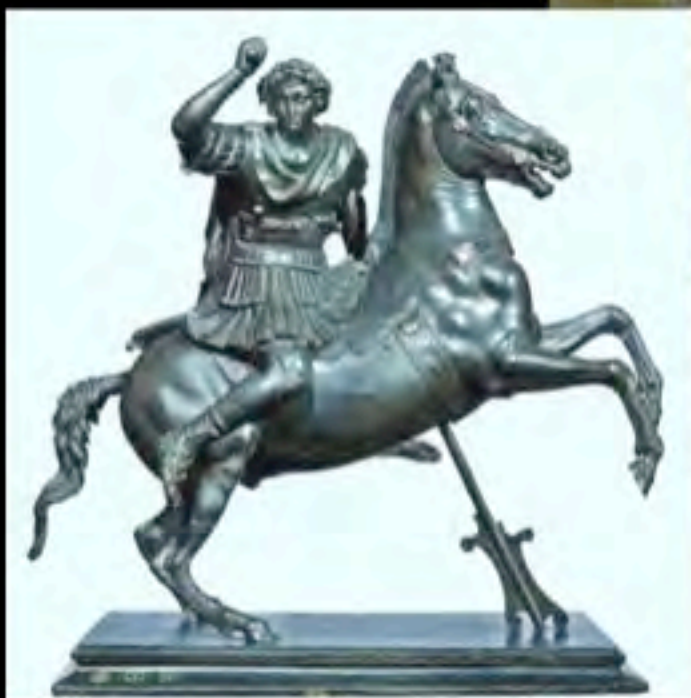
a sinistra : Alessandro cavalca Bucefalo, copia romana in bronzo, Ercolano. Si noti la seduta arretrata del cavaliere, che non disponeva delle staffe