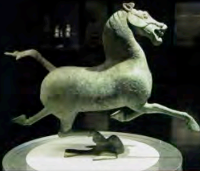
Cavallo volante , statuetta in bronzo, Cina, dinastia Han, 100 a.C. Rappresenta un cavallo di razza Fergana, originaria dall'Asia centrale