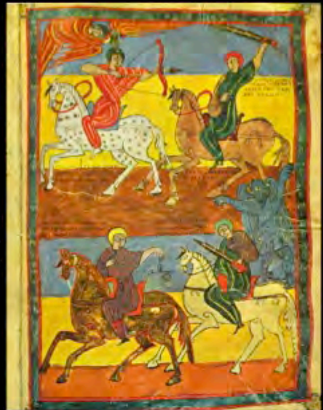
Manoscritto di Valladolid, anno 970, tavola dei quattro cavalieri dell'Apocalisse, opera del monaco Oveco