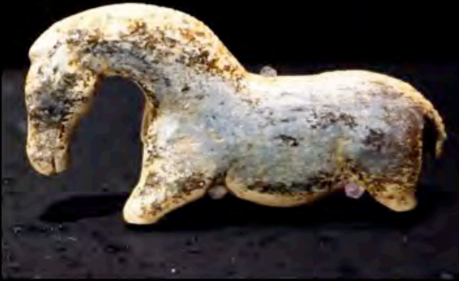
Scultura di cavallo in avorio di mammut, grotta di Vogelherd (Germania), cultura aurignaziana, 30.000 a.C.