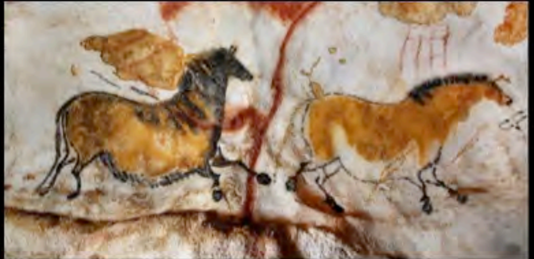
Pitture rupestri nelle grotte di Lescaux (Francia), 15.000 a.C.