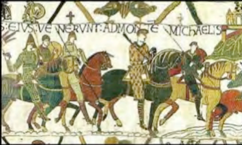
Scena XVI dell' Arazzo di Bayeux, realizzato probabilmente in Inghilterra verso l'ano 1000

Con l'avvento del Cristianesimo le raffigurazioni "eroiche" del cavallo tendono a diminuire, sostituite da scene della quotidianità religiosa e civile o dall'inserimento dell'animale in vicende di sapore biblico. il cavaliere comincia sempre più ad assomigliare al perfetto cortigiano cristiano, puro di cuore e votato a salvar pulzelle