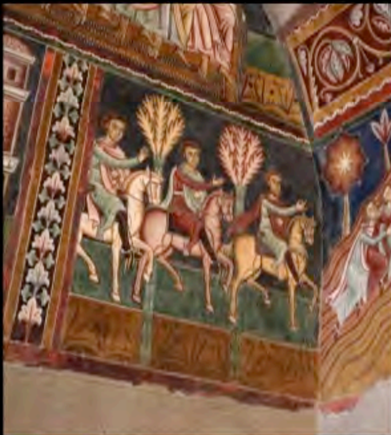
Incoronazione di Papa Silvestro, affresco entro l'oratorio di San Silvestro, Roma, 1248