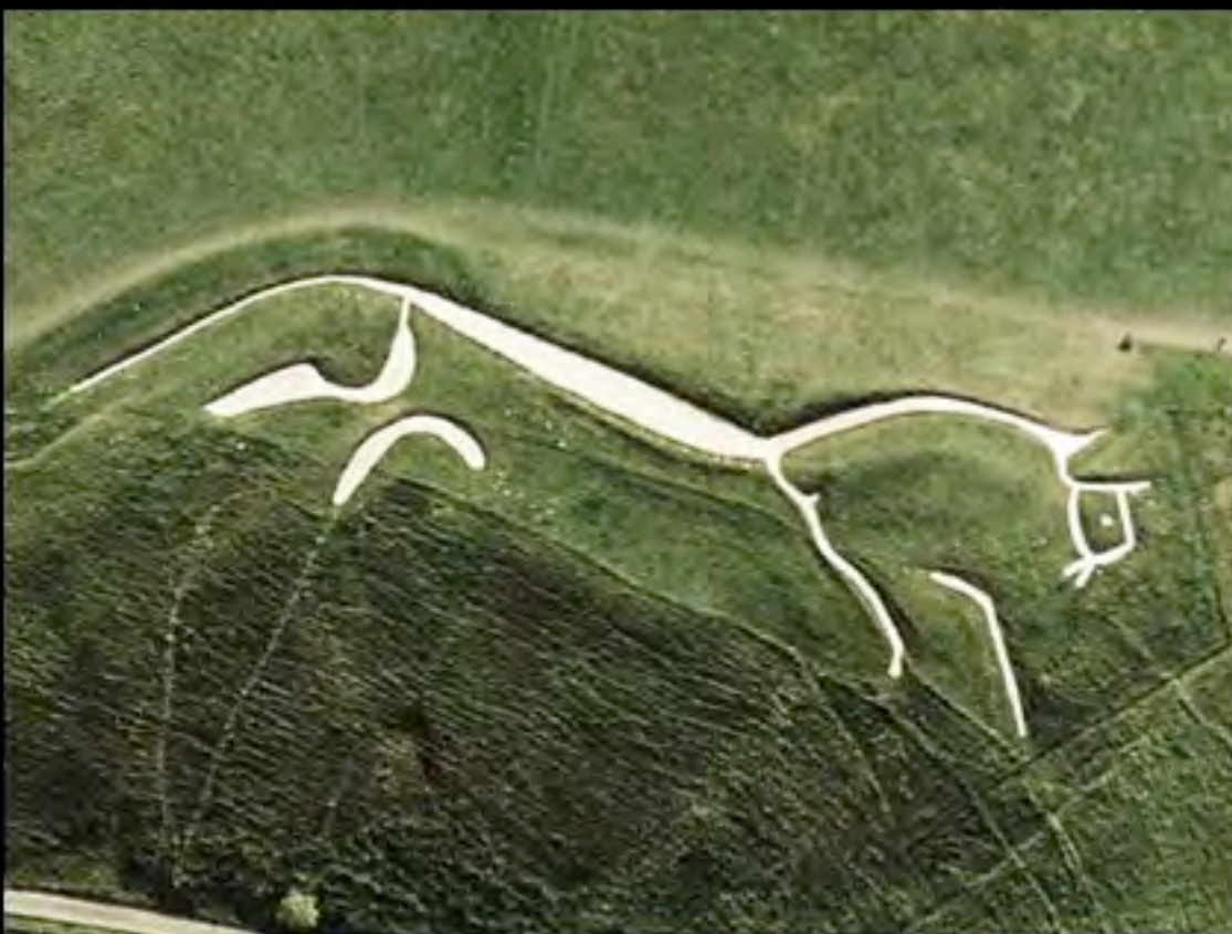
Il Cavallo bianco di Uffington (UK), incisione nel terreno di una collina, 114 metri x 34, profondità un metro, età del bronzo. Ogni sette anni le tracce vengono scavate nuovamente per mantenerle bianche