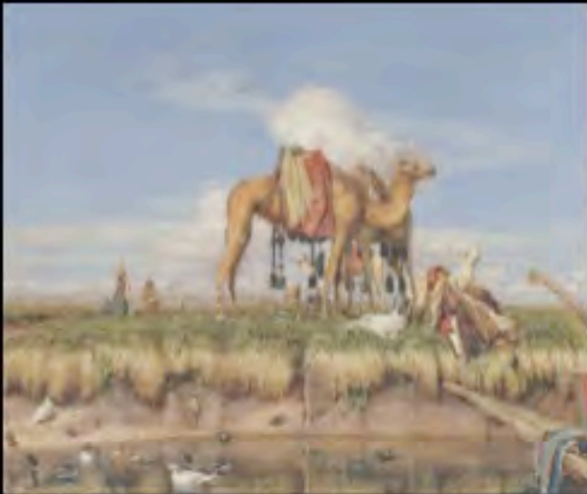
John Frederick Lewis, Sulla riva del Nilo nell'Alto Egitto, 1876