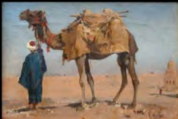
Cesare Biseo, Dalla serie Impressioni dal Cairo , 1870