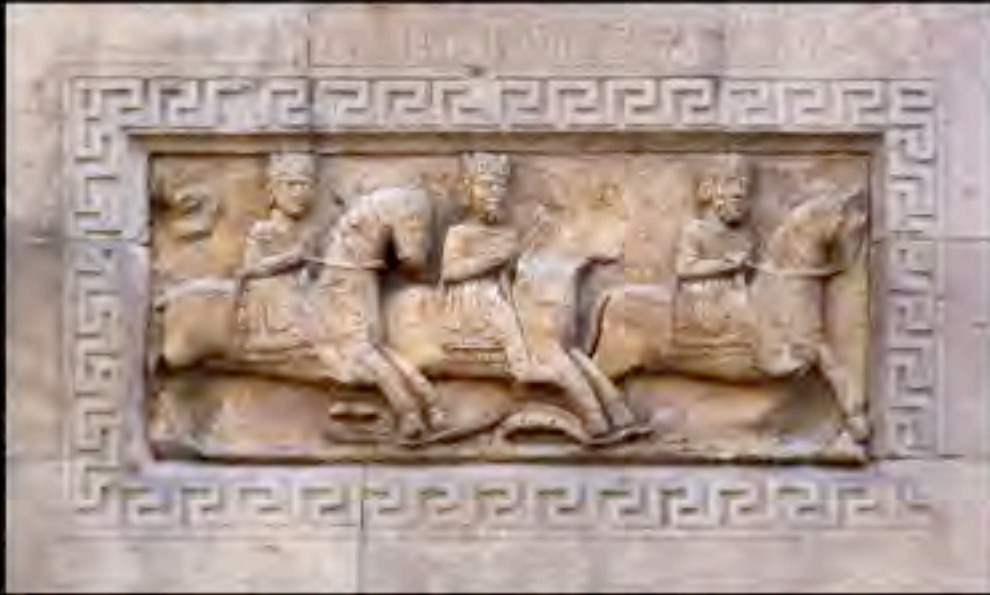
Duomo di Fidenza, bassorilievo della torre campanaria, I tre Re Magi , XII secolo