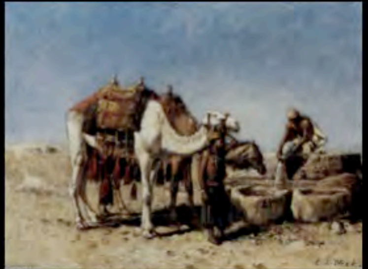
Edwin Lord Weeks, Cammelli presso un pozzo a Tangeri, 1880