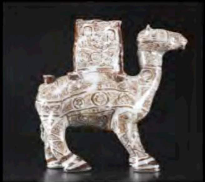
sopra e a sinistra: soprammobili di epoca Tang