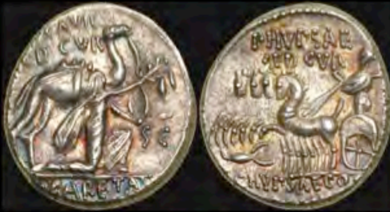
Denario d'argento che celebra la vittoria di Marco Emilio Scauro sul re di Nabatea Areta III, sconfitto dai romani nel 62 a.C.. Il re è rappresentato in ginocchio a fianco di un dromedario