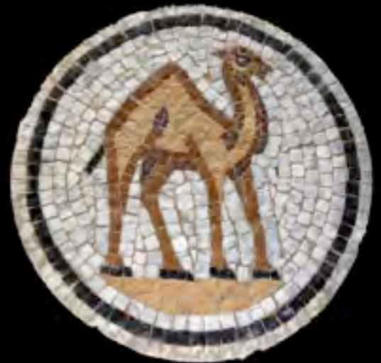
Cammello nel deserto, mosaico romano del terzo secolo d.C.