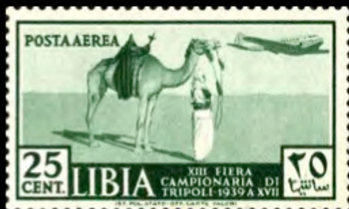
Francobolli coloniali italiani