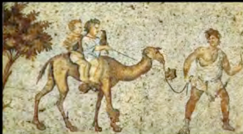
Mosaico bizantino, Bambini su un cammello , ca 570 d.C., Istanbul