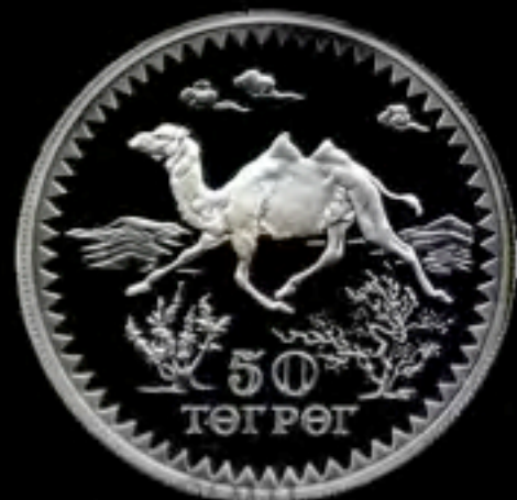
Moneta mongola, 1976