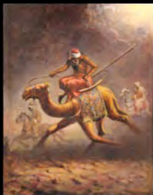
Leonardo De Mango, Turco sul cammello , 1925