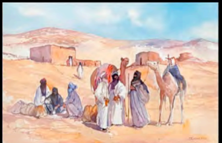
Michel Burbeau, Scena animata in un villaggio dell'Atlante, 1940