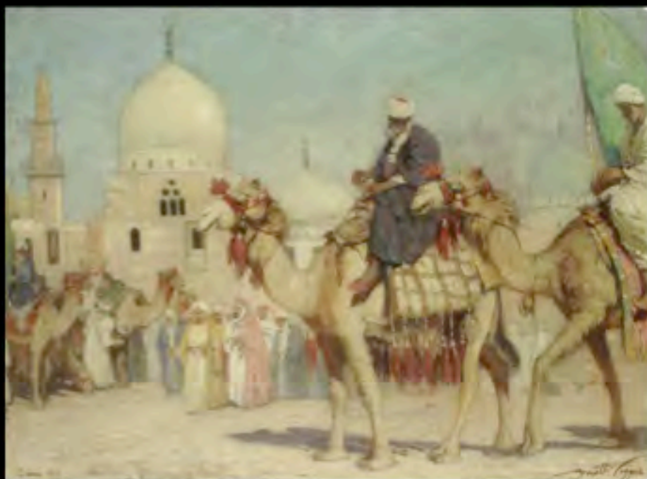
Mario Moretti Foggia, Alle tombe dei Califfi , 1910