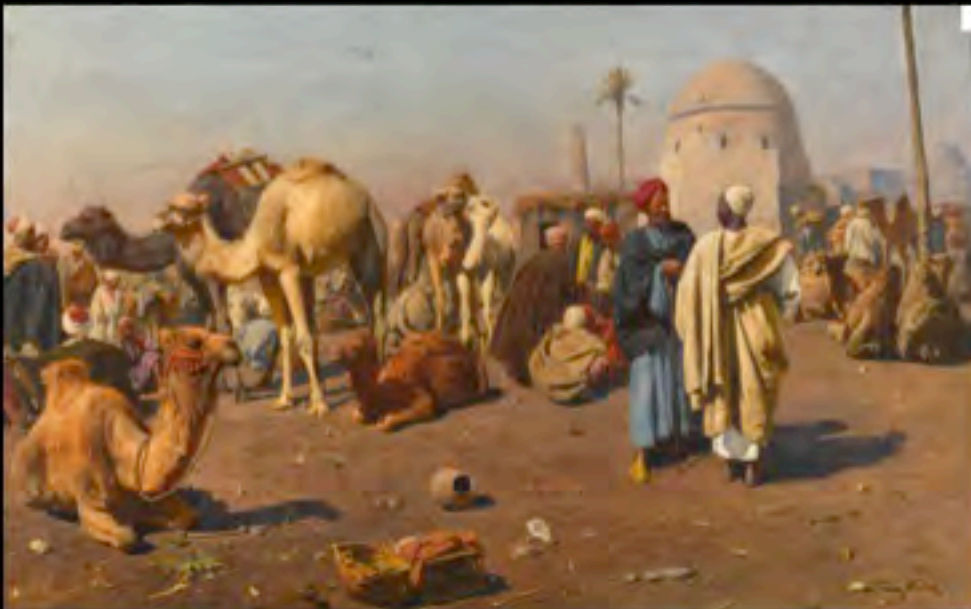
Franz Xaver Kosler, L'arrivo della carovana, ca 1890