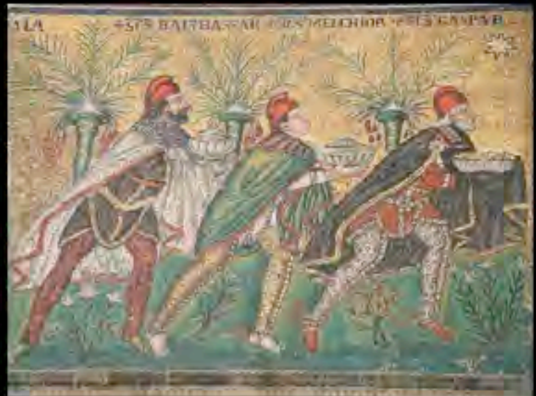
Basilica di Sant'Apollinare Nuovo a Ravenna, dettaglio dal mosaico Maria col Bambino attorniato da angeli , 526 d.C.

Forse i Re Magi non sono arrivati a Betlemme in cammello. L'unica citazione evangelica dei Magi si trova in Matteo, 2, 1 e suona "Gesù nacque a Betlemme di Giudea, al tempo del re Erode. Alcuni Magi giunsero da oriente a Gerusalemme". Anche alcuni Vangeli apocrifi parlano dei Magi, ma alcuni biblisti ne mettono in dubbio perfino l'esistenza. Nulla si dice di quali fossero le loro cavalcature, potrebbero essere state cavalli, come appare nella lapide del Duomo di Fidenza, oppure potrebbero essere venuti a piedi. L'inserimento dei cammelli nel presepio è invenzione recente, forse spagnola (dove i cammelli erano stati diffusi durante l'invasione araba) o napoletana.