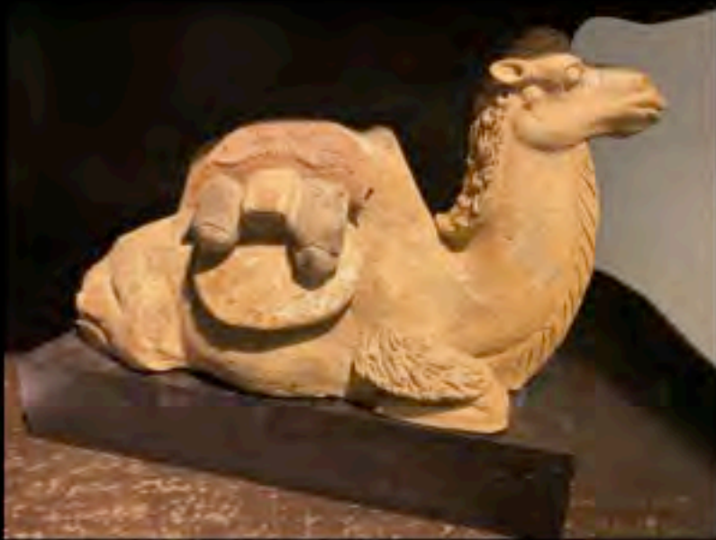
Cammello in terracotta, Cina, ca IV secolo d.C.