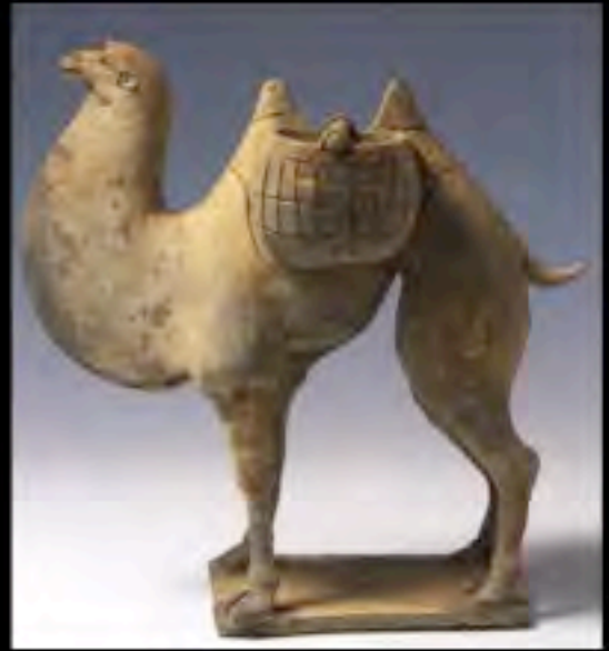
Cammello con ceste, Cina, seconda metà del VI secolo d.C.