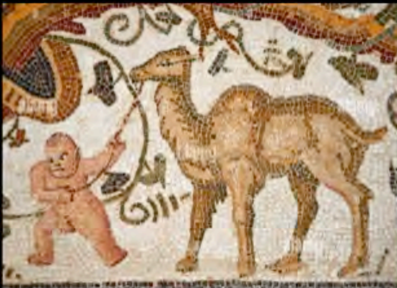
Mosaici della città romana di Thysdrus (attualmente El Jem, Tunisia). A sinistra: Un amorino conduce un cammello alla casa di Sileno, a destra: Processione dionisiaca