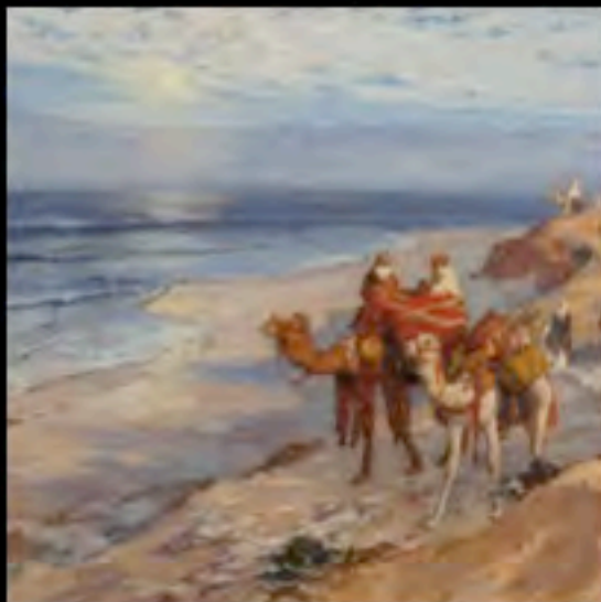
Frederick Arthur Bridgman, L'Atlantico a Tangeri, 1925